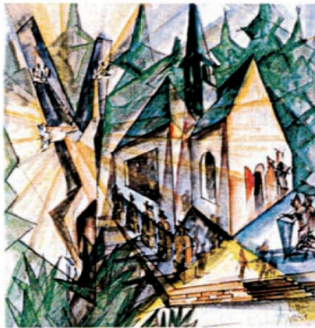
ECCE HOMO - Kreuzkapelle Püttlingen